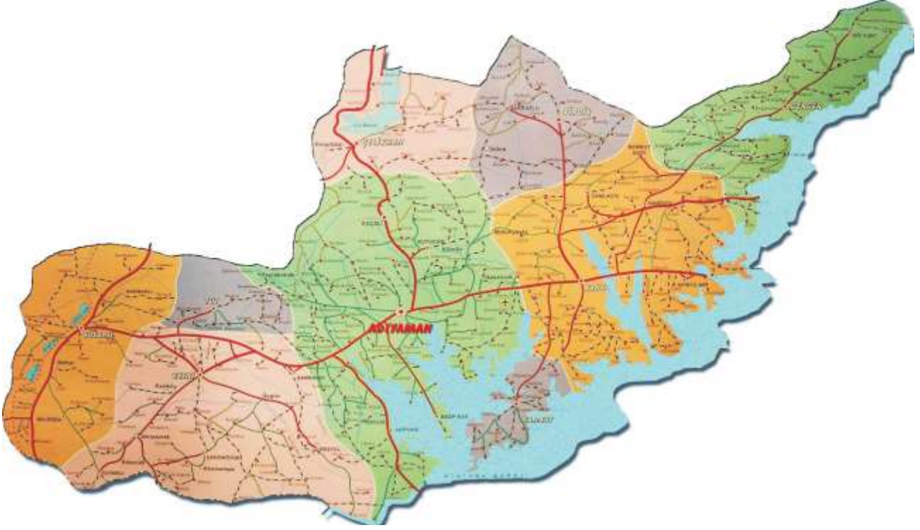
Adiyaman İli Haritası